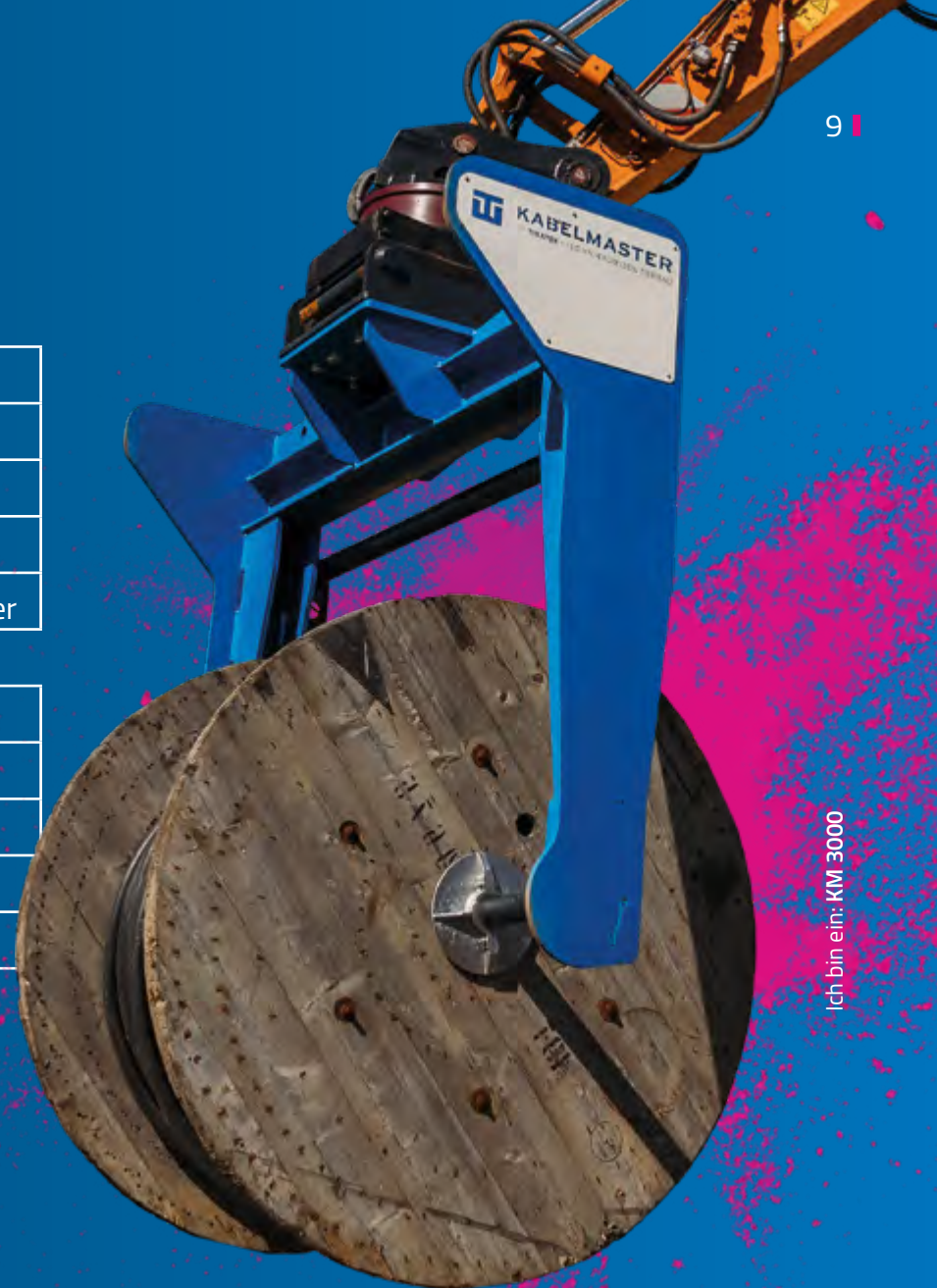
Ich bin ein: KM 3000